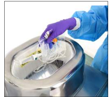
Inkontinenz-Entsorgung usw. direkt im Pflegezimmer